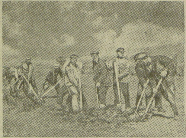
Колхозники сельхозартеля „Красный труд“, Ново-Александровского района на земляных работах.