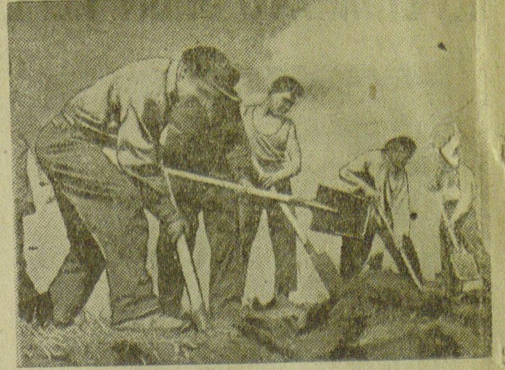
Колхозники сельхозартели „Красный труд“, Ново-Александровского района, строят дамбу.

На сегодняшний день в силу отсутствия надежной охраны имеются случаи ухода с пастбища лошадей. Из колхоза „Коминтерн“, Петровского района, ушло 2 лошади, из колхоза им. Кирова, Спицевского района— 2 лошади, из колхоза им. Калинина, Труновского района— 10 лошадей. Эти данные свидетельствуют о нерадивом отношении к сохранению социалистической собственности руководи-